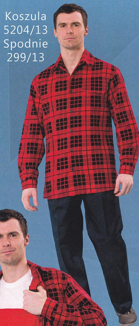
Koszula 5204/13 Spodnie 299/13