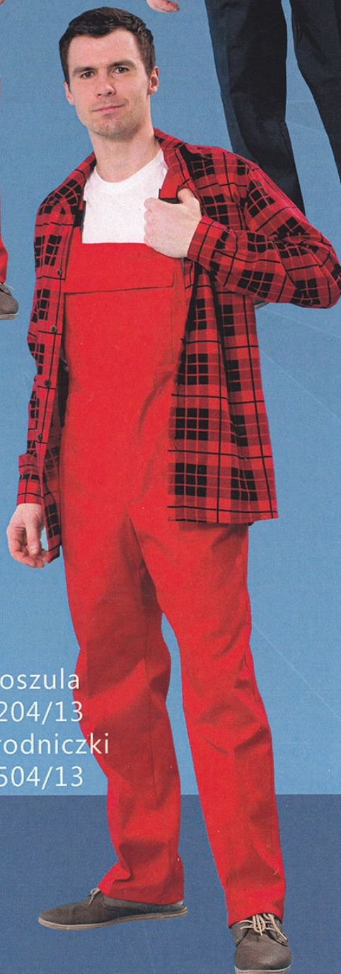
Koszula 5204/13 Ogrodniczki 5504/13