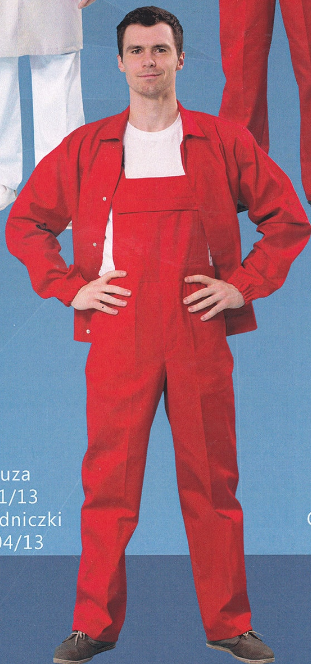
Bluza 711/13 Ogrodniczki 5504/13