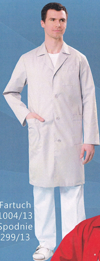
Fartuch 1004/13 Spodnie 299/13